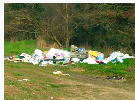
Bois du Cornailler.

Il en va de la qualité de notre environnement à tous. Pour information, la Mairie a déposé deux plaintes ce mois-ci concernant ces décharges intolérables et 400 kg de déchets ont été ramassés par les employés municipaux et emportés en déchetterie et cela nous est facturé donc par conséquent payé par les contribuables de la commune.