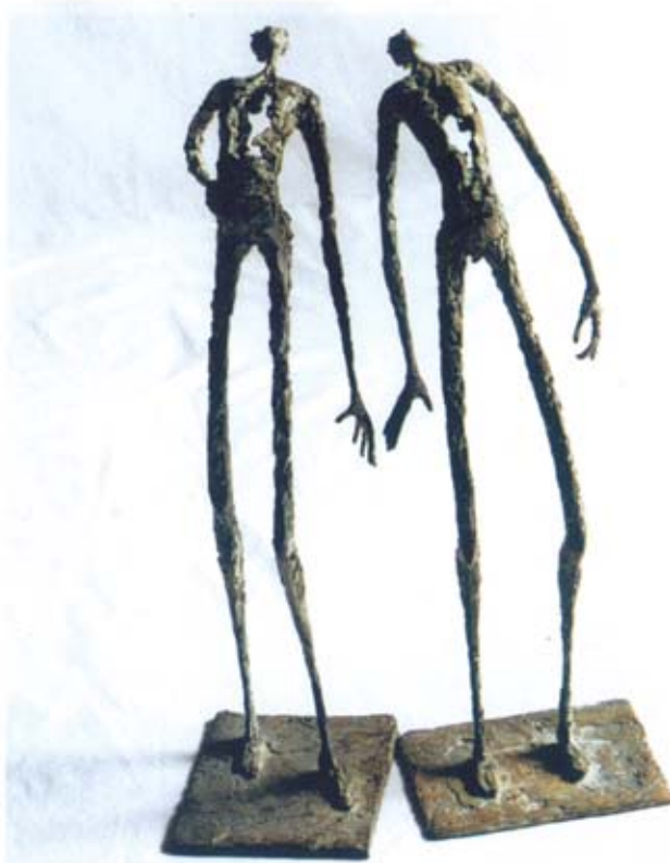
Observateurs de nuages Bronzes d'après cire directe

L'oeuvre de Pascale Marchesini-Arnal tourne autour du thème unique de la figure humaine transfigurée par la fragilité des matériaux.